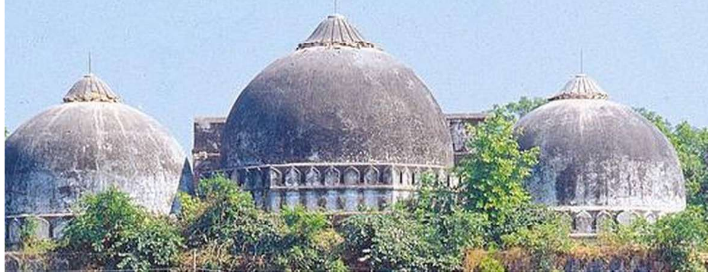
The Babri Masjid