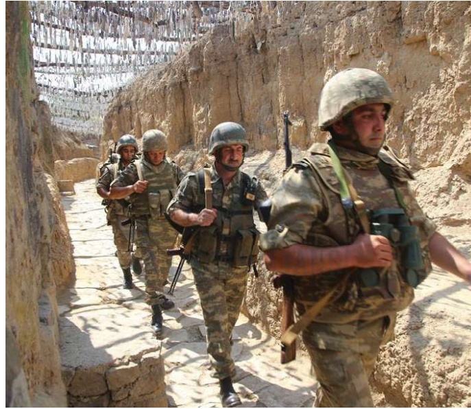
Soldiers going to the conflict zone of Nagorno Karabakh